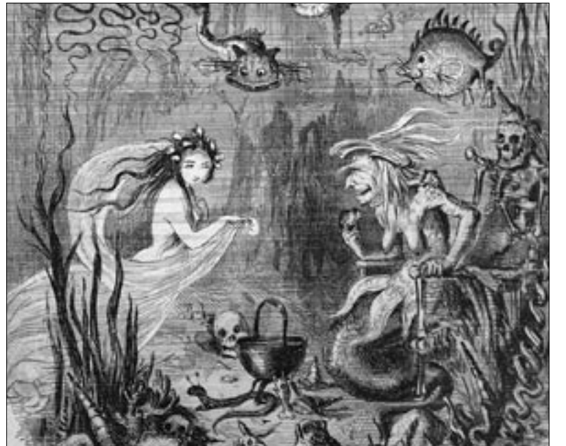
Illustratsioon Anderseni muinasjutule "Väike merineitsi".

Falcki ekipaaž sõidab öösel Kaupluse "24 H" paanikahäire peale kohale. Selgub, et on toimunud rööv ning ära on virutatud kassapaarat. Müüa näitab kahe isiku suunas, kes on juba "horisondi" taha kadumas. Ekipaaž asub kahtlustatavaid püüdma. Isikud jooksevad kalmistu poole. Järgijooksev ekipaaži liige, kes kõike toimuvat Häirejuhtimiskeskusele edastab, jõuab samuti kalmistule. Paari minuti pärast teatab turvatöötaja, et viibib kalmistul, kuid ei leia kahtlusaluseid isikuid üles. Selle peale soovib HJK: "Kaeva sügavamalt!"