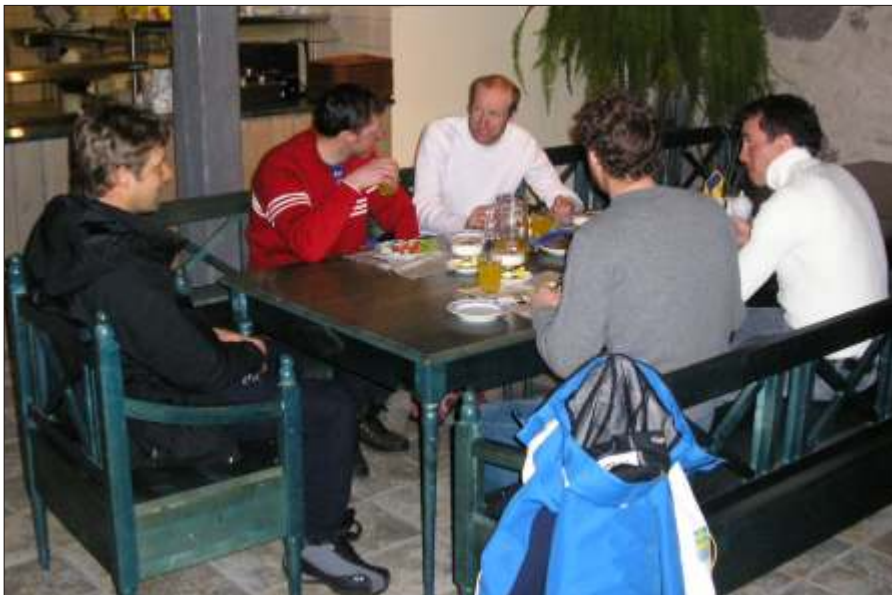
Suusatajad Toiduaidas söömas.