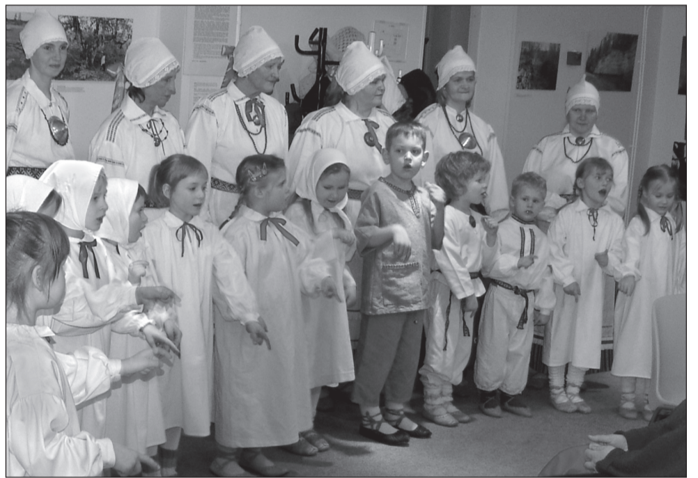
PARHOMENKO EDUARDI PILT

Maavalla kua vanõmb Kaasiku Ahto tekk valla ka Eesti luudusligõ pühäpaiku pildinäütise, miä jääs ka- emisõs kuu lõpuni.