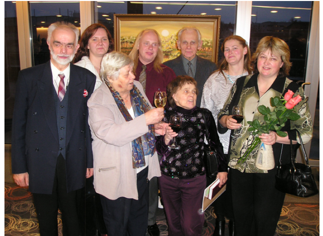
Puuetega inimeste päeval Tartus 3.12.2008

on toimunud mitmeid teabeüritusi kurtidele ja vaegkuuljatele mõeldud eri-suitsuandurite kohta. Head sõbrad ja võitluskaaslased! Ees ootavad rasked majandusaastad. Kuidas arendada nendes tingimustes organisatsioonilist tegevust, läbi viia üritusi, olla võimekas tööturul, saada vajalikke kuulmisabivahendeid, vaadata subtiitritega telesaateid? Endiselt ei ole hoonetes, kus toimuvad koosolekud, üritused jm, vaegkuuljale vajalikke kuulamistingimusi, erivõimendusseadmeid. Juurutamist vajab tekstitõlge. Väga oluline on koostöö ametkondadega ja omavalitsustega. Nendest ja kindlasti veel ka paljudest teistest ühinguid puudutavatest küsimustest, tahame rääkida 28. märtsil Tallinnas läbiviidaval EVL Üldkogu koosolekul.