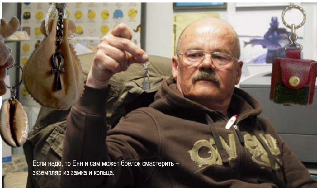
Если надо, то Энн и сам может брелок смастерить — экземпляр из замка и кольца.

Сейчас в коллекции брелоков Энна уже примерно 350 экземпляров. «Основной критерий коллекционирования в