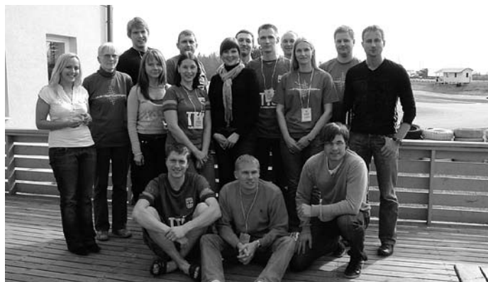
Ajurünnakul osalenud pärast kokkuvõtete tegemist

Magistrite hinnangul väärivad esiletõstmist juba praegu Ambla vallas tegutsevad Aravete motoringrada ja Aniste krossirada. Magistrid soovitsid neid võimalusi laiemalt teadustada,