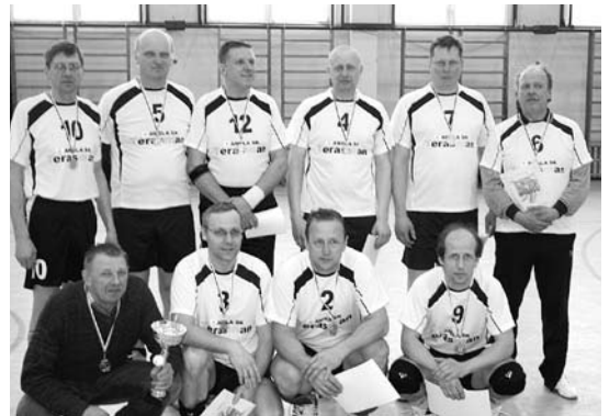
Ambla SK veteranide võrkpallimeeskond

K, 27. mail kell 18 FC Sport – FC Ekvaator, Aravetel.