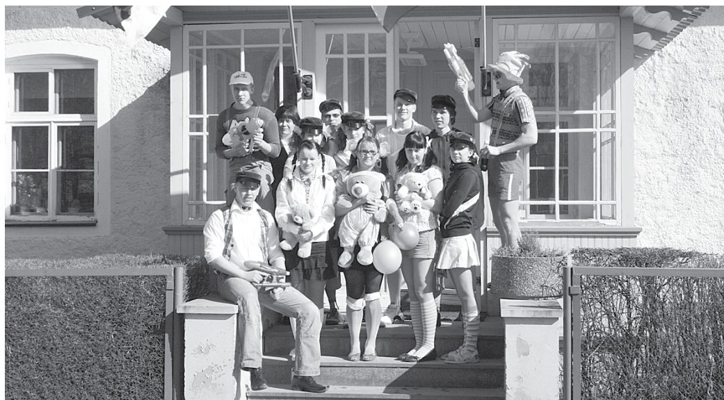
Aravete KK abiturientid vallamaja trepil 22. aprillil 2009.