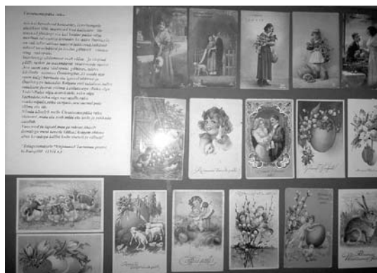
Osake näitusest „Lihavõtted ja kevadlilled läbi aegade“