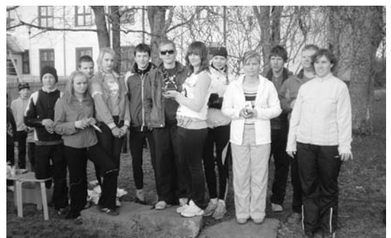
Jüriöö jooksu võitjad

L, 30. mail kell 12 FC Ekvaator – Roosad Pantrid; JK Ummistus – FC Sport; kell 13 FC Päästjad – JK Väik ja Pauk; Roosad Pantrid – JK Ummistus; kell 14 FC Sport – JK Väik ja Pauk; Kossutiim – FC Ekvaator, Arulagedal.