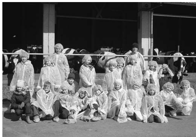
Ambla kooli algklasside lapsed Mägise farmis

Ambla Lasteaed-Põhikooli algklasside lapsed