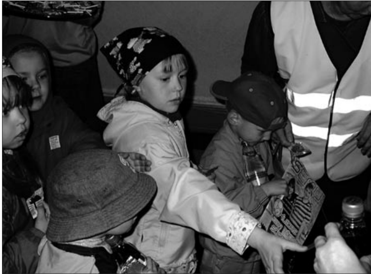
Semu värse numbril esimesed õnnelikud omanikud ajakirja esitluspäeval kinos Sõprus.

Lindsalu sõnul väärivad kindlasti toonitamist põhimõtte, et Semu levib nüüd ja edaspidi tasuta. “Kui