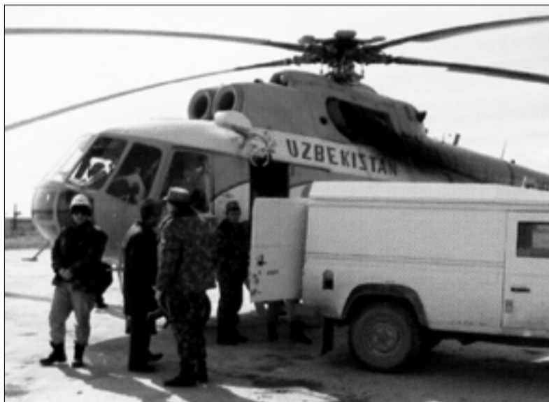
Kaugete kaevanduste puhul, nagu näiteks KEM Indoneesias (üla) ning Z-N Usbekistanis, peab kulla ja kalliskivide veoks kasutama helikoptereid.

kus vastavad spetsialistid saadete akrediteerivad.