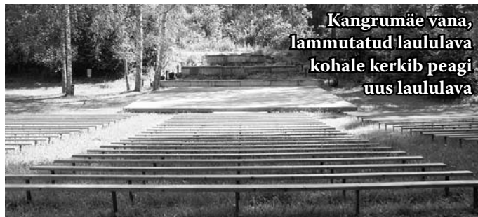
Kangrumäe vana, lammutatud laululava kohale kerkib peagi uus laululava

Nimetatud PRIA meetme rahastamise korra kohaselt tuleb toetuse saajal objekt eelnevalt valmis teha, mis hõlmab ehituse lõpetamist, sh esitatud arvete tasumist ja aruande esitamist, pärast mida kontrolli-