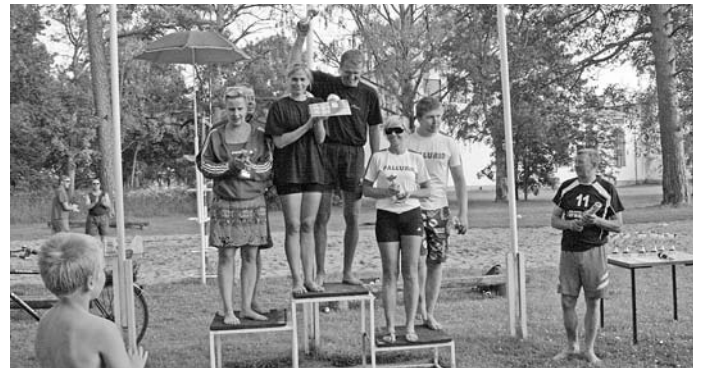
Aravete Rannavolle segapaaride võitjad