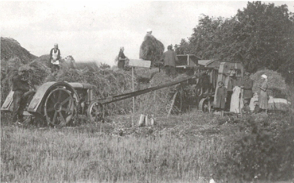
Rehepeksupäev Kuusalu khk. Uuri küla Pulga talus (Talu asub nüüd Riiklikus Vabaõhumuuseumis)

1850. aastal mõõdeti Kolga mõisa heinamaa ja lõikusetükid nii suured, et teorjad kättemõõdetud tükke söömavaheaegade vahel enam niita – lõigata ei jaksanud..