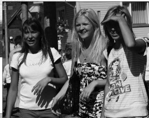
Kuigi peol osales rohkem kui 400 isetegevuslast, jagus rongkäigu teele ka ergutajaid