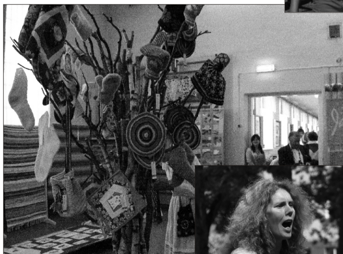
Üks pisike puu oli peo ajaks kasvanud ka Suure-Jaani kultuurimaja saali, kus olid välja pandud valla käsitöönaieste-meeste tööd. Kauni näputöö seadsid näituseks Suure-Jaani Huvikooli naised