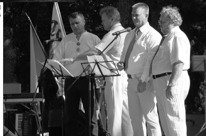
Valla kolmas laulu- ja tantsupidu pakkus ka üllatusi - üks tore üllatus oli ilmselt volikogu lauluansambel, mille neli liiget peol vaatajatekuulajate ette astus