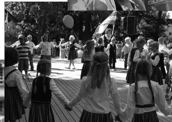
⋈ Kõige rohkem uut ja huvitavat kogesid kindlasti lasteaialapsed, kelledest paljudele oli see pidu esimene laulu- ja tantsupidu, kus nad osalesid