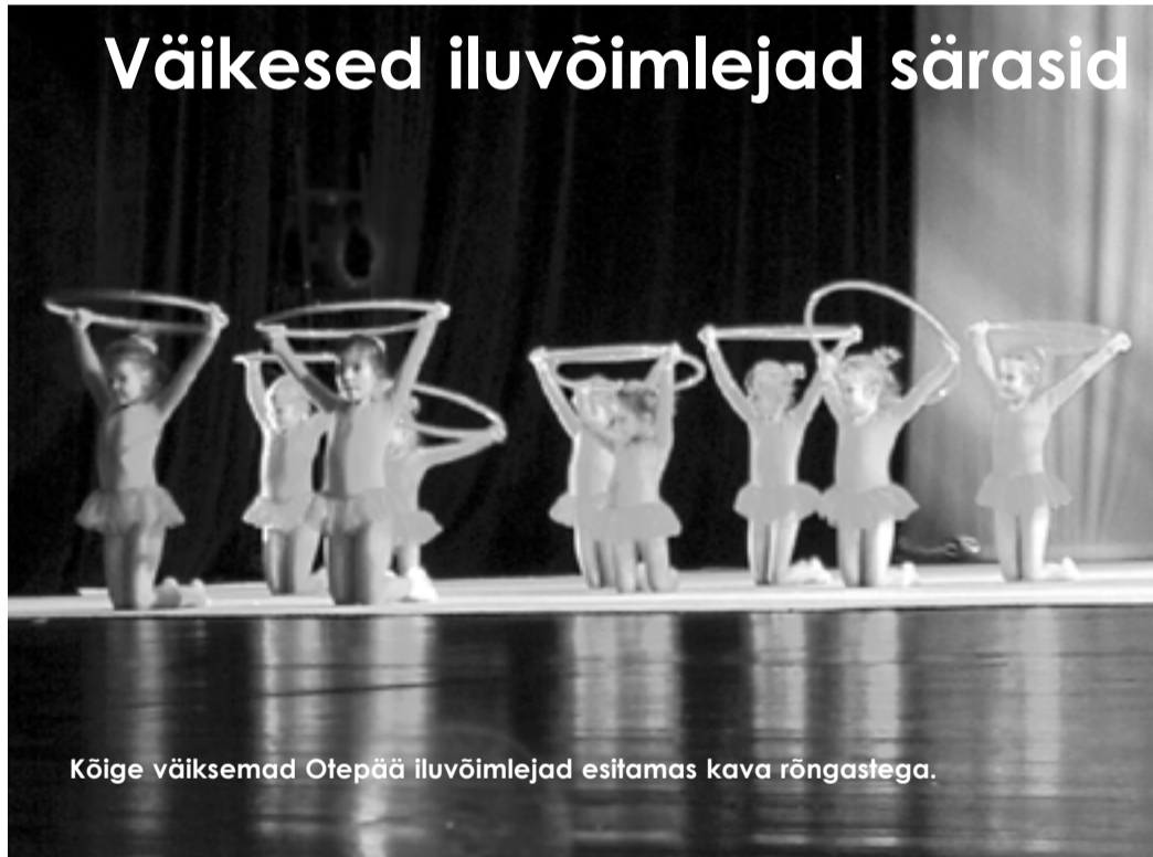
Kõige väiksemad Otepää iluvõimlejad esitamas kava rõngastega.

20. detsembril toimus Tartus Vanemuise suures saalis võimlemispidu «Jõulud lumeriigis».