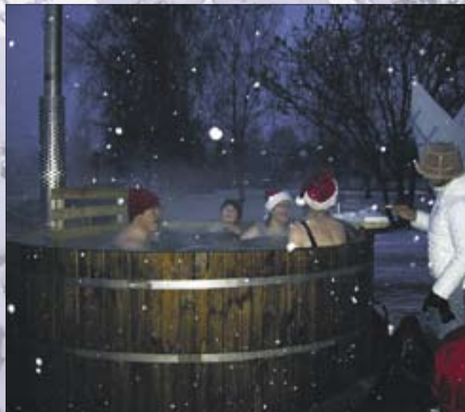
▲ Karastunud tunnisaunalised nautisid saunamõnuseid hillsõhnuni, laskmata end segada neid uudistavatest kubujussidest.