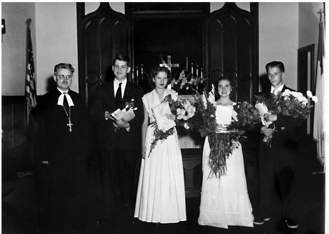
EELK San Francisco Kogudus