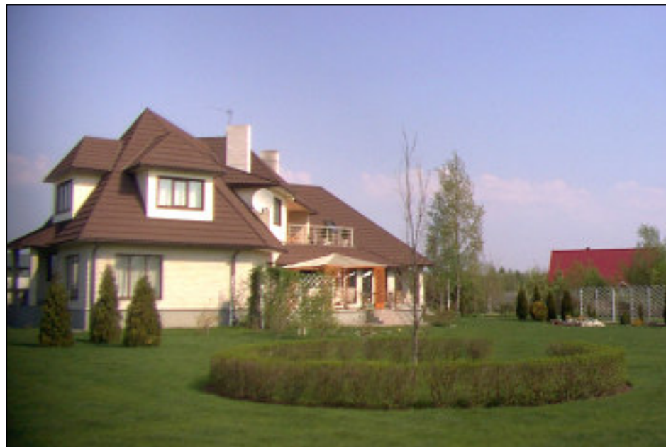
Linnu tee 6 perekond Laanemetsa ja OÜ Alve eramu