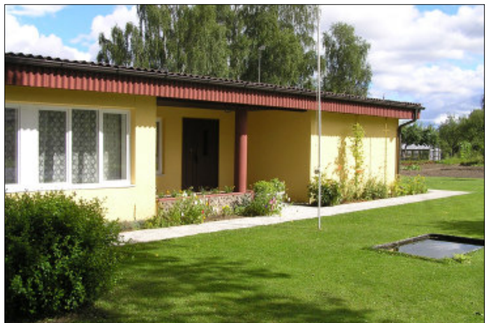
Seljametsa tee 6 perekond Aljase kodumaja

Korterelamute hulgas on tulnud järgmine kaunit re-