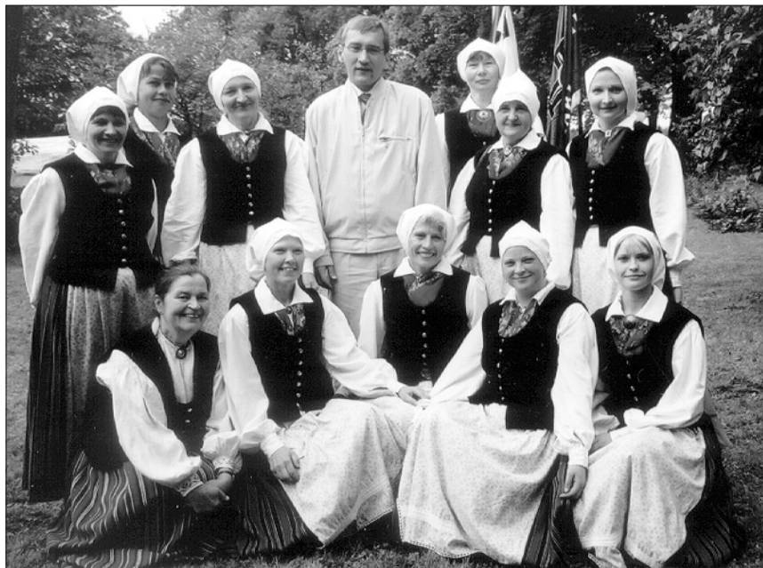
● Tänaõhtu rahvamaja naistantsurühm kutsus pildile peaministri.