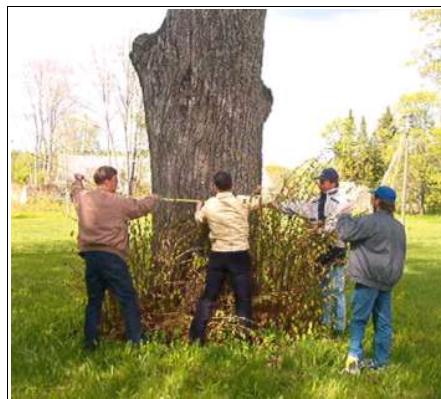
Atla pärna mõõtmiseks oli vaja nelja meest!

On asju, mis oma vägevusele vaatamata jäävad tähelepanuta, sest me oleme nendega nii harjunud, et ei peagi neid erilisteks. Nii on paljud mööda käinud Atla mõisapargi suurest pärnast, millele pühapäeval mõisaüritusel juhuslikult viidati, et vaadake kui vägev puu pargis kasvab. Ruttu otsiti mõõdulint ja rinnakõrguselt mõõtes andis see 4 meetrit välja. Muidugi ei löö ta pjedestaaliit näiteks Mustjala 6,8-meetrise pärna, aga meie jaoks on ka seda küllalt. Atla pärn on oma elu viimases faasis: latva jäänud veel mõned võraoksad ja tüvi on täis musträhni pesaauke, mida loetleti 8. Kindlasti peab puu aga veel aastat kümme vastu.