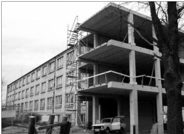
Spordihoone valmimisega muutub ka Tapa gümnaasiumi fassaad huvitavamaks.

Tapa spordihoone haldamiseks on loodud linnaasutus