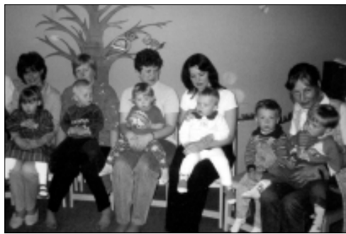
Pisikesed laululinnud koos emadega beebikoolis.

Muusikalised mõjutused beebieast alates laulu-, rütmil-, pillimängu, liikumise ja muusika kuulamise kaudu soodustavad igakülgset lapse arengut. Tähtsald on emotsioonid. Laulu saatel mängitades toetamegi lapse emotsionaalset, keelelist ja motorset arengut. Beebikoolis õpivad lapsed kuulama meid ümb-