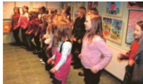
Näituse "Kelleks tahan saada?" avamine Tabasalu raamatukogus.

kel soovi ja tahtmist kaasa lüüa ühingu selle aasta tegevuskava elluviimisel. Info meie kodulehel: www.harkulaps.ee.