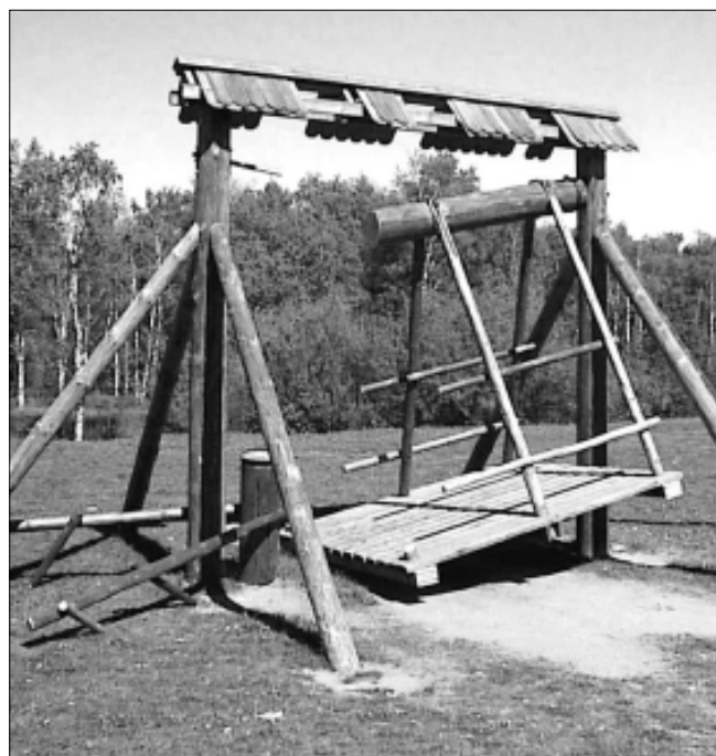
Linnalaanikke vapustas eelmisel nädalavahetusel Valgejõe saarel linnakiige purustamine. Vandalismiakti toimepanija on meie linna kodanik ja politseile teada.