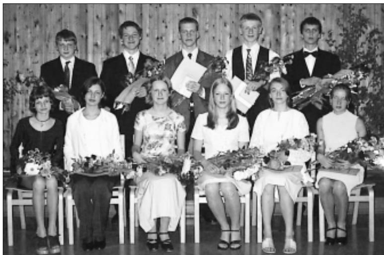
Muusikakooli 41. lennu lõpetas 11 õpilast.