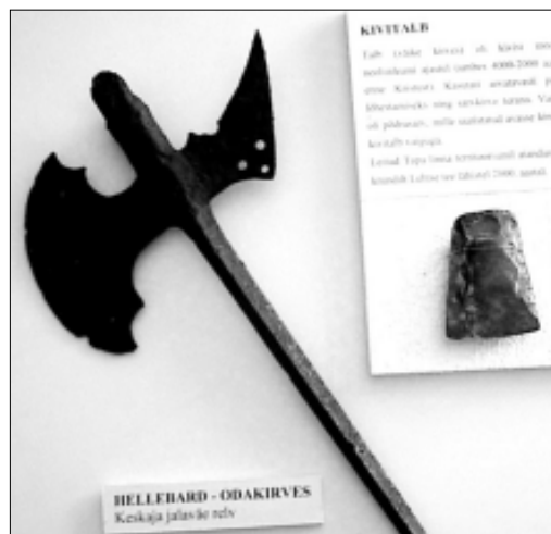
Sõjakirvest ja talba saab näha Tapa muuseumis.