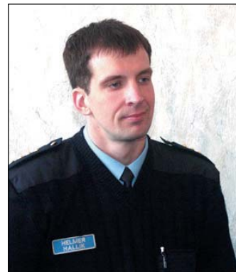
has kainenemat ellusuhtumist.

Sobiv oleks eeltoodud mõtetele lisada üks näide. Asudes Jõgeva linna konstaablina tööle, panime koos kolleegidega tähele, et paljud linnakodanikud pöörduvad meie poole murega, et avalikus kohas alkoholi tarvitavad inimesed häirivad nende igapäevast normaalset elu. Sai me signaali, et see on probleemiks. Pöörasime sellele suuremat tähelepanu ja juba mõne nädala möödudes hakkasid meile rahulolematust avaldama alkoholi kuritarvitajad ise. Nüüd tundsid nemad ennast puudutatuna. Kuid minu sõnum neile on lühike ja konkreetne. Meie koos linna kodanikega soovime avalikus kohas kainen keskonda ja teie peate selle omaks võtma! Usun, et nii mõnigi linna kodanik on täheldanud viimasel ajal avalikus ko-