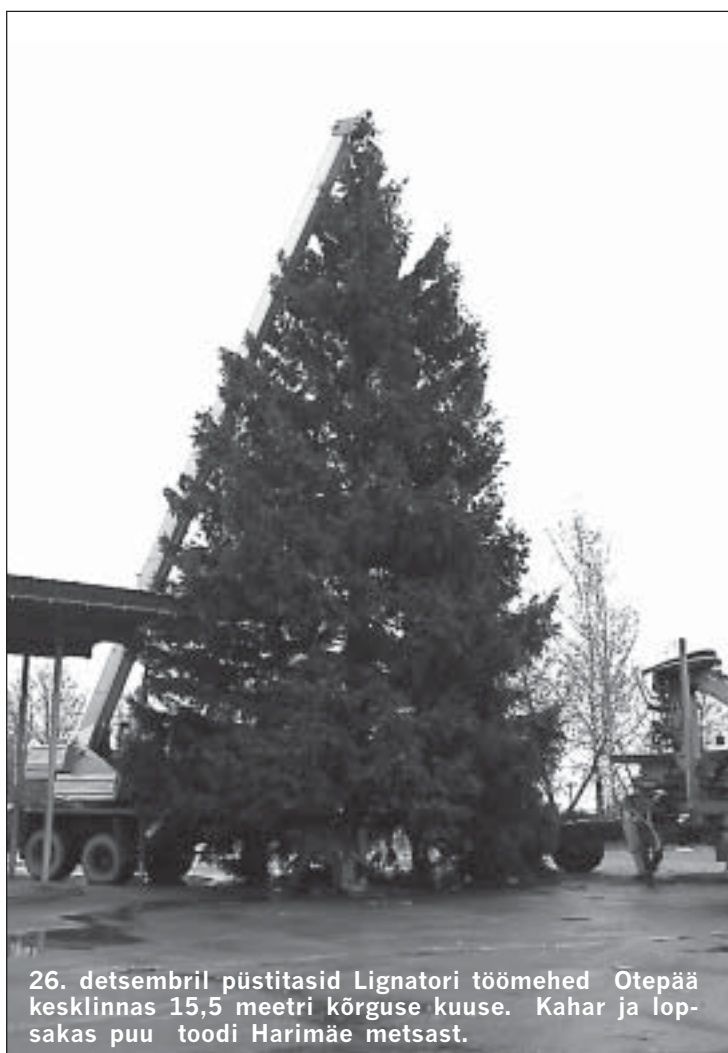
26. detsembril püstitasid Lignatori töömehed Otepää kesklinnas 15,5 meetri kõrguse kuuse. Kahar ja lõpsakas puu toodi Harimäe metsast.

ENNO FASTER SA Valgamaa Äriinfokeskuse projektijuht