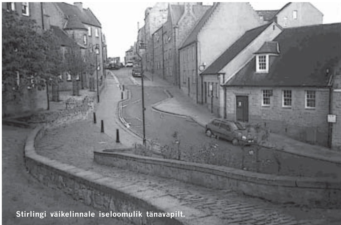
Stirlingi väikelinnale iseloomulik tänavapilt.

Sel aastal tutvustas Šotimaa oma turismipotentsiaali. Sealne turismiametite võrk Visitscotland ühendab 14 regionaalset turismiametit. Piirkonna, kus meie vii-