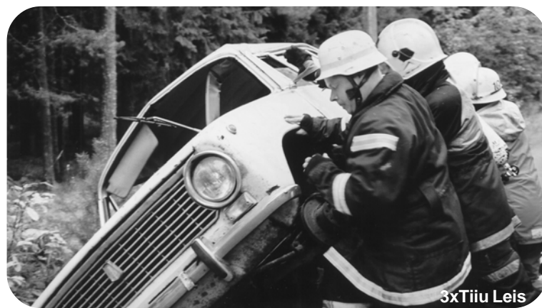
Kannatanud õnnelikult autost väljas, tuli ka tee autorisust vabastada.

Õppuse legendi kohaselt oli Harjumaal asuvat Loksa linna ja selle lähiumbrust tabanud tugev sügistorm, mis käivitas ulatusliku õnnetuste ahela. Õnnetuste tagajärgede likvideerimise kaasati hulgaliselt operatiivüksusi ja -tehnikat päästeasutustest, politseist, kiirabist, piirivalvest, kaitseliidust ning mitmetest teistest organitsatsioonidest.