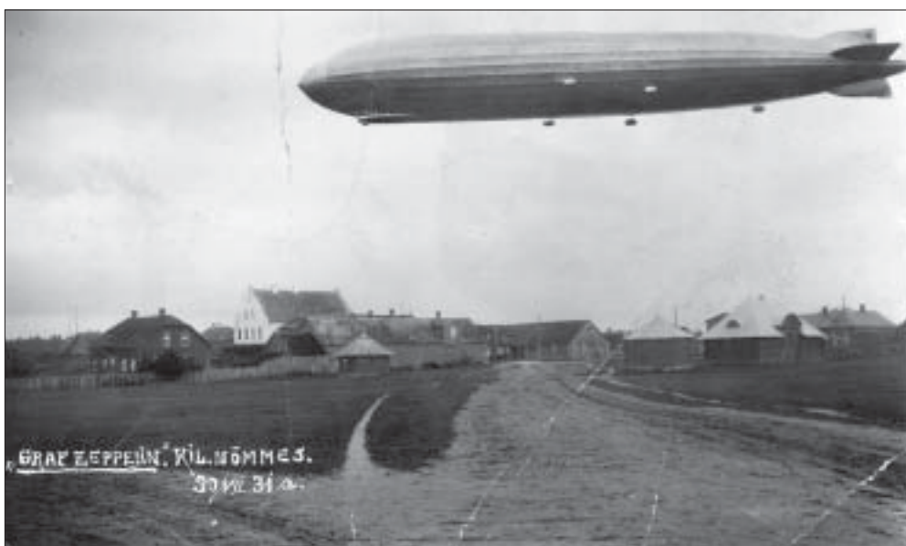
Graf Zeppelin Kilingi-Nõmme kohal, 30.07.1931.