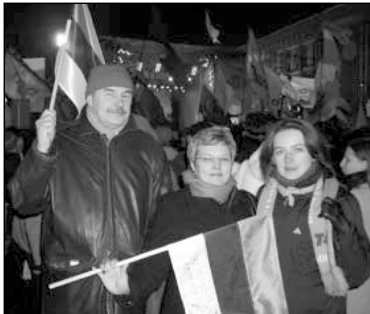
Kiievis valimiste viimase voo öhtul 26. detsembril, kui oli selge, et Viktor Juštšenko võitis.

Pragueks on näiteks Ukraina otsustavalt väljendanud oma tahet liituda euroliiduga. See loob Ukraina võimukandjatele ja kodanikuühendustele uue sihi – selgitada rahvale juba varakult ELi olemust ja liitumishoovust, samuti liidus avanevaid võimalusi. Kasvõi selles osas