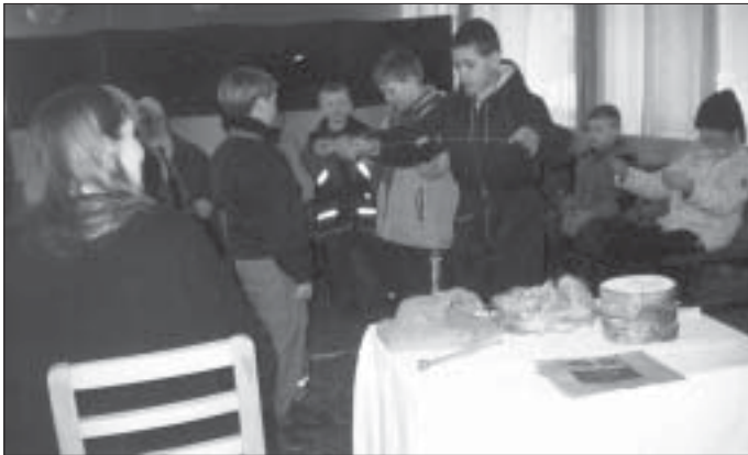
VASTLAPÄEV – "PÕNEVAT TEGEVUST JAGUS KÕIGILE"