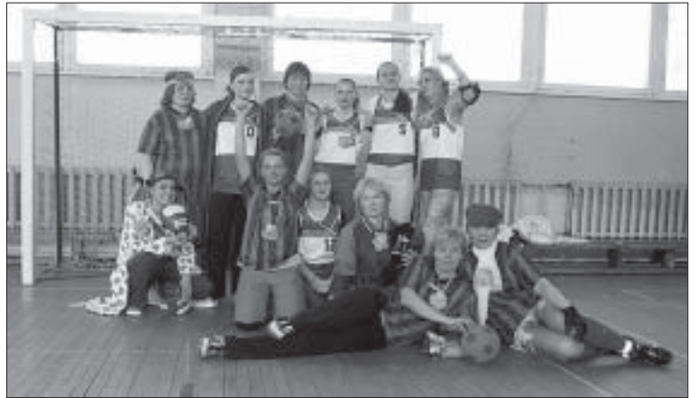
"PÄRAST VÄSITAVAT MÄNGU GRUPIPILT"

Poolfinaalide vaheajal ergutasid nii võistlejaid kui pealtvaatajaid prominentsed ning kuumad Vanilla Ninja tibid (loe – kümnenda klassi poisid). Rahvast küttis veelgi rohkem üles Eurovisiooni eelvoorust tuntud loo „Kung fu” enneolematu esitus.