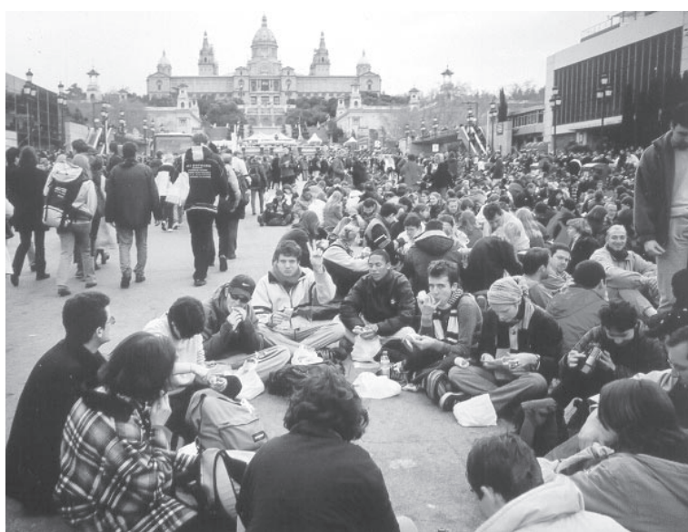
Kataloonlaste rahvusmuuseumi ette Barcelonas viie päeva jooksul kogunenud umbes 80 000 eri rahvusest "palverändurit" ei takistanud ükski piir.