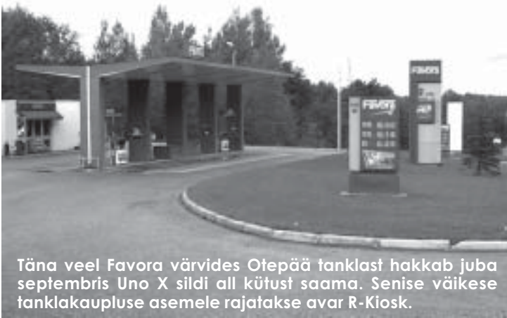
Täna veel Favora värvides Otepää tanklast hakkab juba septembris Uno X sildi all kütust saama. Senise väikese tanklakaupluse asemele rajatakse avar R-Kiosk.