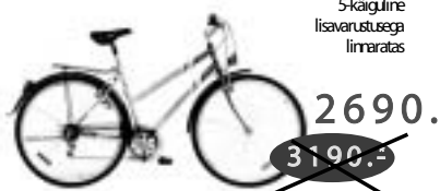
CITYLADY 5-käiguline lisavarustusega linnaratas