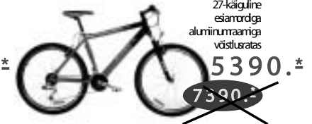
RACER SRAM 7,0 27-käiguline esiamordga alumiiniumraamiga võistlusuratas