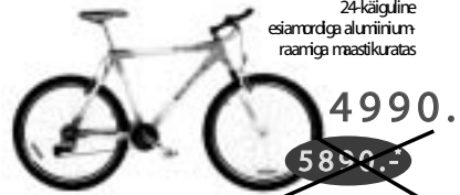
EXPERT SRAM 5,0 24-käiguline esiamordga alumiinium- raamiga maastikuratas