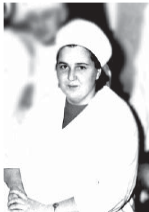
On mälestus helge ja puhas, on mälestus Sinust me jaoks. Ei kunagi muutu see tuhaks, ei iial me südameist kao.