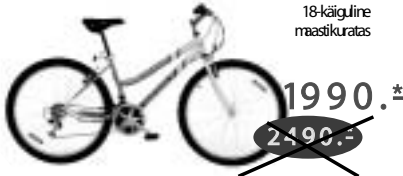
LADY SRAM MRX 18-käiguline maastikuratas

MELLEX-AUTO Lipuväljak 28A, 67406 OTEPÄÄ tel. 076 55 168