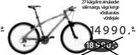
CORRATEC SUPERBOW FUN 27-käiguline ainulaadne väljumisega, väga kerge võistlusuratas võistlejale