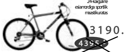
SRAM 5,0 SF 24-käiguline esiamordga sportlik maastikuratas