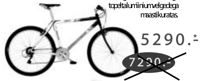
BIANCHI 760 RS 24-käiguline G-Mbraaniga topetalumiinimvelgedega maastikuratas