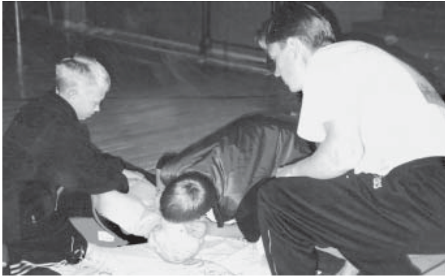
Otepää gümnaasiumi poisid harjutavad kunstliku hingamise tegemist.