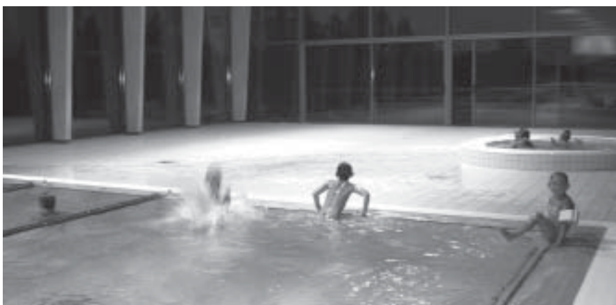
Pühajärve puhkekeskuse ujula on avatud kõigile. 13.septembril on huvilistele lahtiste uste päeva raames võimalik uue vabaajakeskusega tutvuma tulla, majaanekursioonid algavad igal täistunnil kell 14-18.

Ligemale aasta eest kunagise Pühajärve mõisa hobusetalli müüridele kerkima hakanud vabaajakeskus on tänaseks vastu võtnud juba sadu veemõnude nautijaid. 30 miljonit krooni maksma läinud ehitise esimesel korral paigneb maakonna ainuke bowlingusaal, samasse sisustatakse lähikaudel kaasaegne jõusaal. Uutesse tööruumidesse on kolinud taastusraviarstid, hambaarst, juuksur, kosmeetik ja maniküür-pediküür. Teisel korrusel