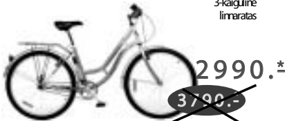
LADY CONFORT 3-käiguline linnaratas