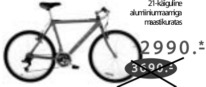
RELAX SRAM 3,0 21-käiguline alumiiniumraamiga maastikuratas