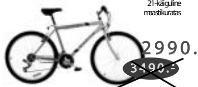
SRAM 4,0 21-käiguline maastikuratas