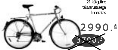
CITYMAN 21-käiguline täisvarustusega linnaratas