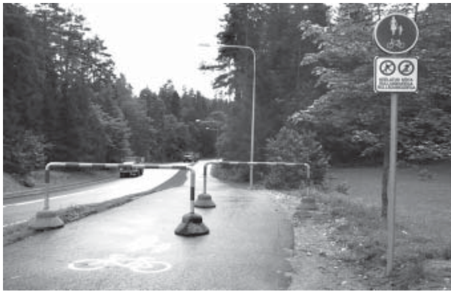
Vastel rattateel on ohtlike ristmikete ees ohutustökendid. Juuresolev märk keelab rulluisutajate ja -suusatajate liiklemise Mäe tn nurgalt kuni Pühajärve ranna parklani.

Otepää-Nüpli-Sihva tee taastusremondi käigus uuendatakse teetruubid, ehitatakse vajalikud teekraavid ning sadevede dreenaž, parandatakse tee muldkeha ning paigaldatakse uus asfaltkate. 9 miljonit krooni