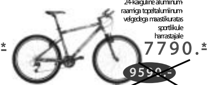
CORRATEC FREERIDE ALIVIO 24-käiguline alumiinium- raamiga topetalumiinim- velgedega maastikuratas sportlikule harrastajale