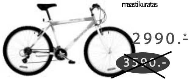
ALTUS 21-käiguline maastikuratas