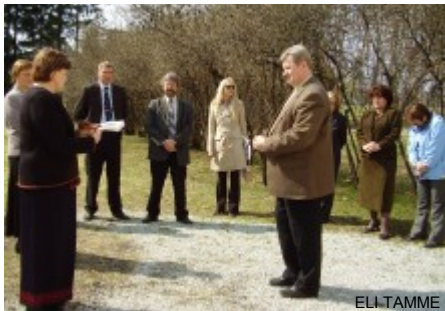
Minister vaatas üle ka remonti vajava Juuru rahvamaja ja vabaõhuväljaku.

T. Schmitte: Tähtsaim eesmärgistatud tegevus on meil jah praegu uue muuseumiga seonduv. Heaks uudiseks oleks, kui selle aasta lisaelarvega saaksime projekteerimise rahastamiseks vajaliku 1,2 miljonit krooni. Sümboolne oli ministri juures see, et ta oli muuseumi vajadustega hästi kursis ning Mahtra mail ja muuseumis enne ministriks saamistki käinud.