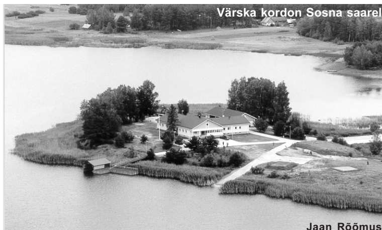
Värskas kordon Sosna saarel