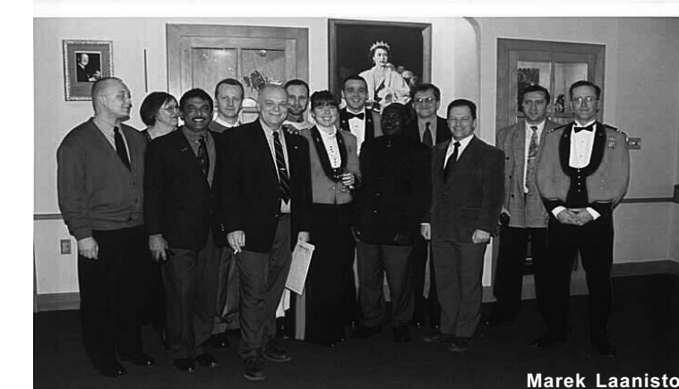
Rahuläbirääkijate kursus Kanadas

1. etapina võeti läbi rahuläbirääkimiste korraldamine ja sõdivate poolte esindajate vastandamine ühise laua taga. Kõik osavõtjad said kindla rollijuhise, mille järgi süveneti oma rolliosas toodud probleemide-