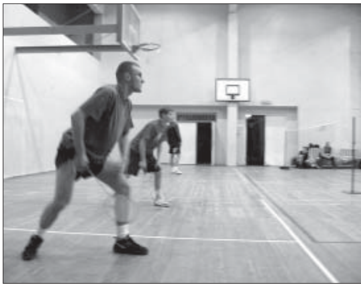
VÕISTLUS ON TÄIES HOOS