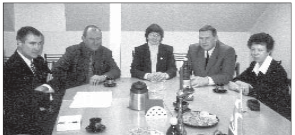
FOTO II MAAVANEM VESTLEMAS VOLIKOGU- JA VALLAVALITSUSE LIIKMETEGA