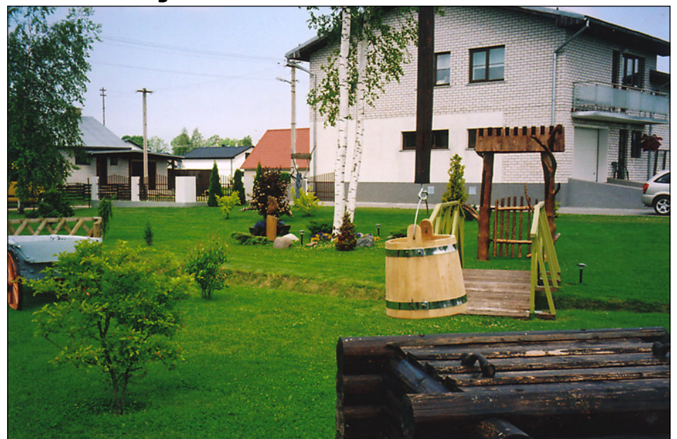
Haigru tn 13 haljastatud aed