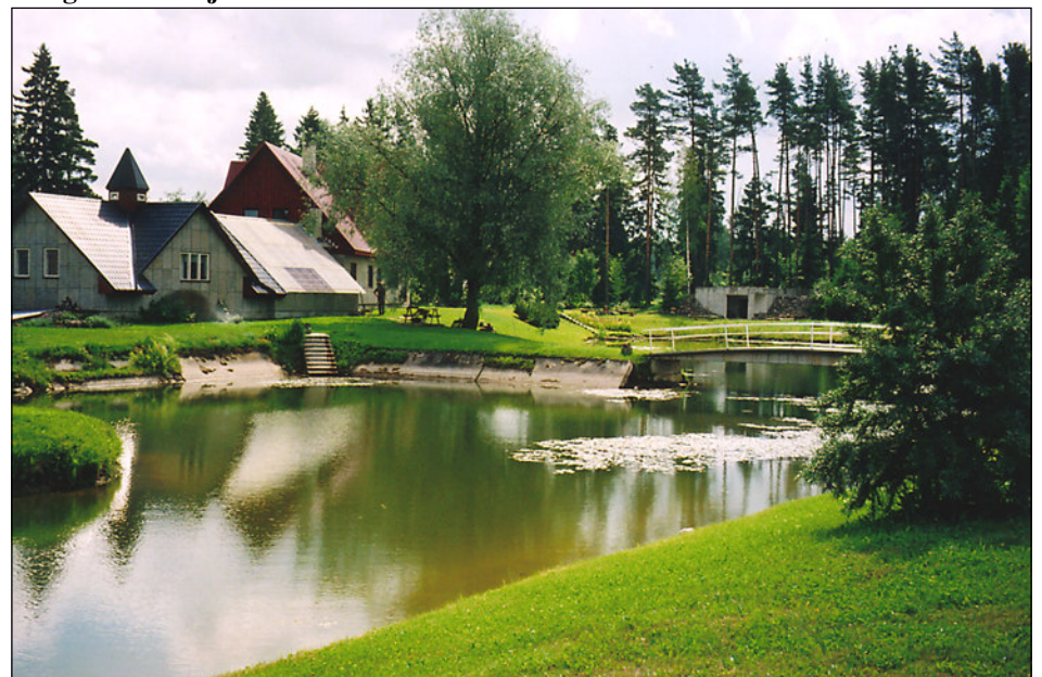
Sõnni talu Seljametsa külas

Juuni keskel tegi heakorrakomisjon vallale teise tiiru peale, et välja valida selle aasta võitjad.