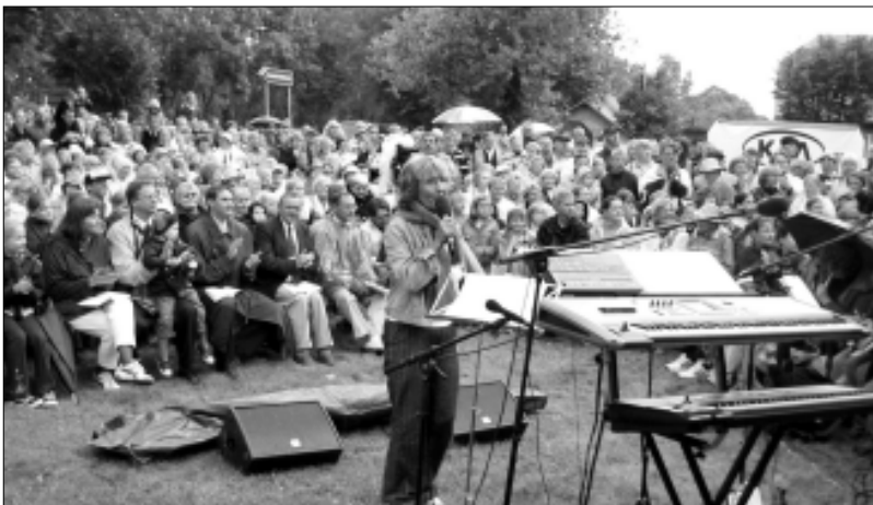
Saate "Laulge kaasa" linnarajamatuksõnne ees oli vaatamata jahedale ja vihmassele õhtupoolikule toonud kokku hulga rahvast