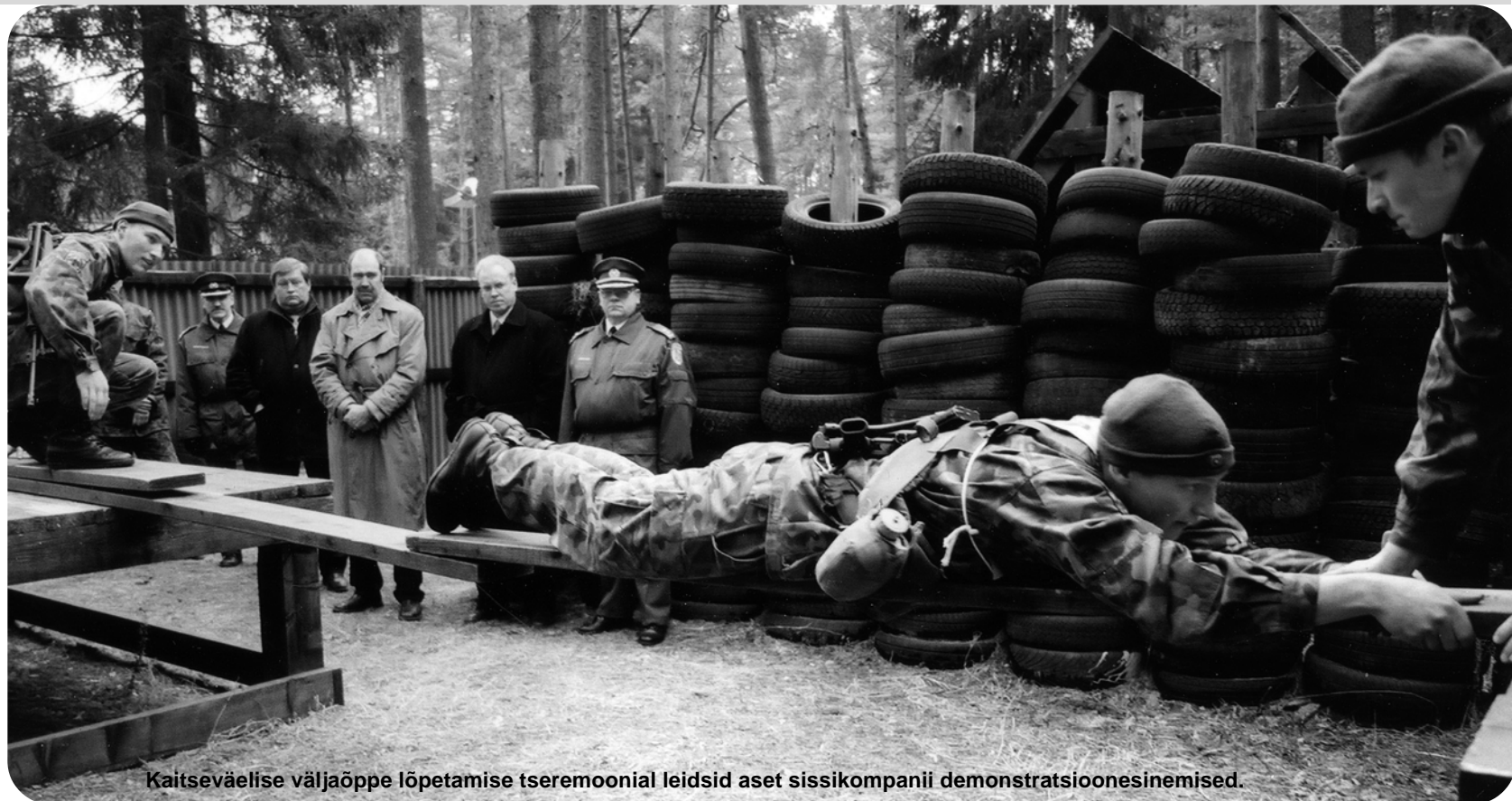
Kaitsevälise väljaõppe lõpetamise tseremoonial leidsid aset sissikompanii demonstratsiooninõuetused.

Õppekeskuse 13 aastat kestnud tegevuse vältel omandas seal kaitsevälise ja piirivalvealase väljaõppe 7574 ajateenijat, piirivalvurit ja piirivalveametnikku. Narva-Jõesuu piirivalve õppekeskuse töö põhisuundadeks kogu tegevusaja vältel on olnud noorte ajateenijate-piirivalvurite väljaõppe, kutseliste piirivalvurite kaitsevälise koolitus ja ajateenijate väljaõpetamine jaoülemate kursustel. Lisaks korraldati täiendõpet ning jaoülemate ja eriala vanemallohvitseride kursusi kutselistele piirivalvuritele. Varasematel aastatel koolitati passikontrolöre ja Soome piirivalveinstruktorite juhendamisel ka piirivalve keskastme juhtivõtteajaid. Üksnes ajateenijatele on õppekeskuses korraldatud 31 õppekursust 4211 õppurile ning 39 nooremallohvitseride ja jaoülemate kursust 969 õppurile. Aastatel 1992-98 oli ajateenijate välja-