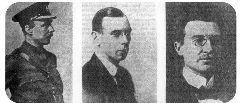
Kolonel Stephen George Tallents, Zigfrids Meierovics, Ado Birk

lents Valga raudteesõlme ja linnasüdame Eestile jätta? Arvatakse, et kindral Laidoneri resolutsioon seisukoht Valga raudteesõlme asjus ja otsus Eesti vägesid Valgast mitte välja viia mõjutasid inglasi sedavõrd, et eelnevad linnapoolitamise kavad jäid ellu viimata. Igatahes on Tallents Valga jagamist edasises töös arvesse võtnud. Kompensatsiooniks Valga eest sai Läti Vabariik mitmes segaasustusega piirkonnas maid juurde. Läti eraldati Heinaste (Ainazhi), Pedeli ja Härgmäe (Erge-me) vald, lisaks said lätlased veel suurema osa Ööbiku (Ipi-ki) ja Vana-Laitsna (Veclai-cene) vallast.