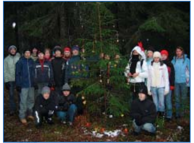
Kaunistasime metsloomadele jõulupuuga.