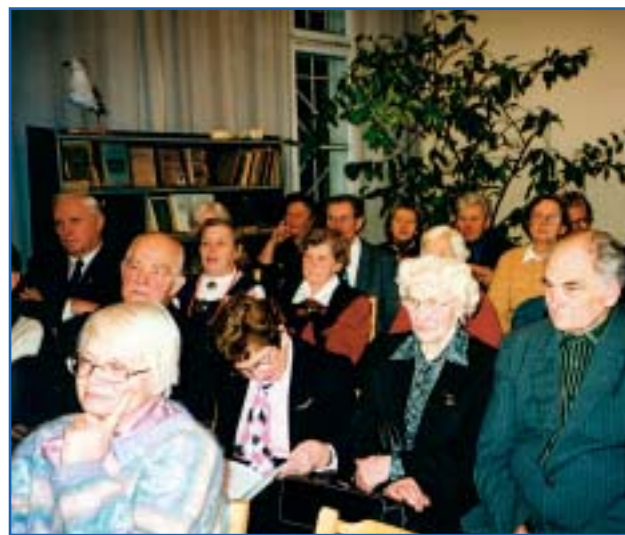
Muuseumisõpru kogunes saali nii palju, et toole tuli juurde tuua.