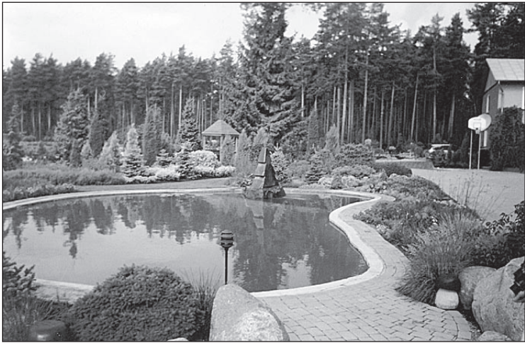
• Lätimaal Baltezeres.