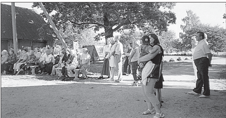
• Sudiste külapäeval.