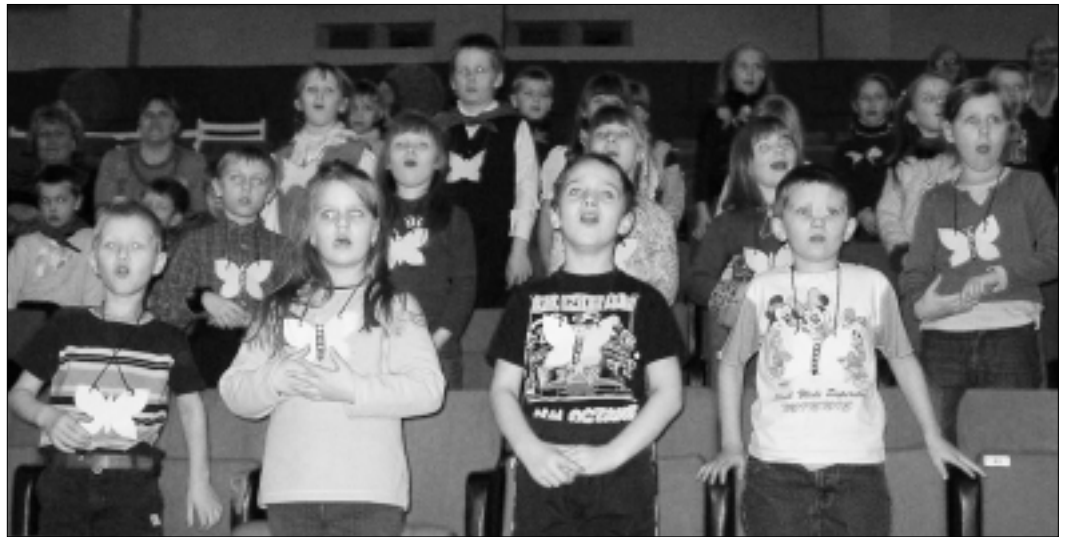
Lapsed laulsid Ave Kumpase eestvedamisel rõõmuga ja täiel hääl.