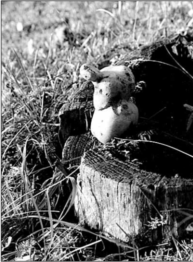
● Tere tulemast, sügis!