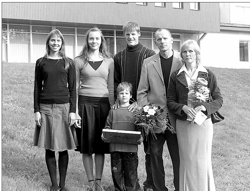
● Alvred on Viiratsi Aasta Pere.

Aasta jooksul toimub viis erinevat kursust: ettevõtluse alused, suhtlemispsühholoogia, inglise keel, arvuti-koolitus ja suvised “meistrikursused”