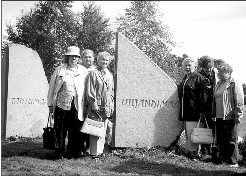
● "Elulõng" Pilistvere kivitahvel Viljandimaa represseeritud mälestava kivitahvel taustal.