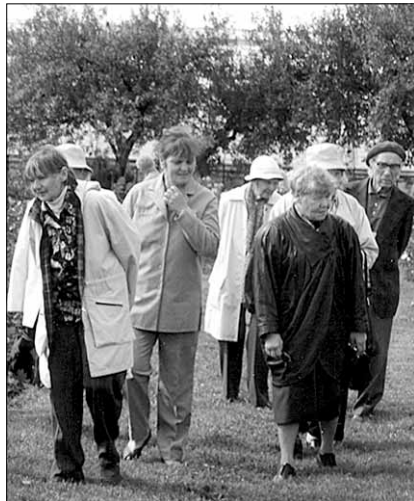
● "Elulõng" tutvub Põltsamaa roosiaias.