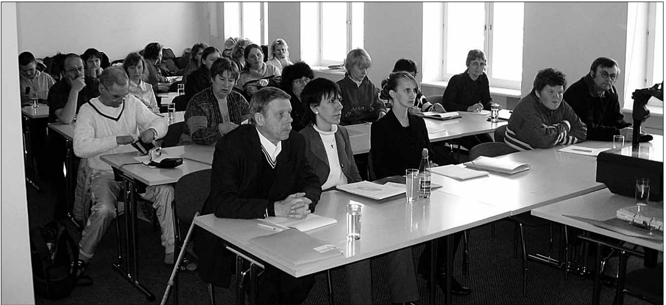
● Türi ja Viljandi grupp on Pühajärvel ühiskoolitusel.