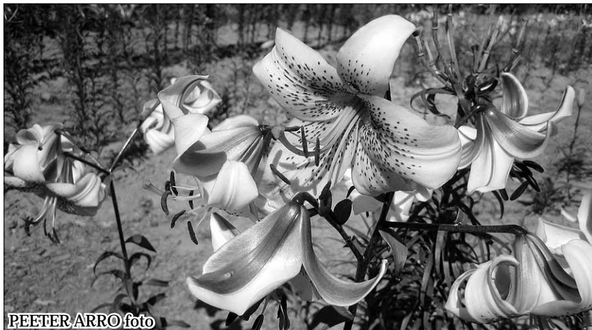
PEETER ARRO foto