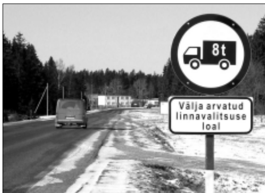
Ka Rakvere poolt Tapa linna sisenajad ootab ees koormuspiirangu märk.