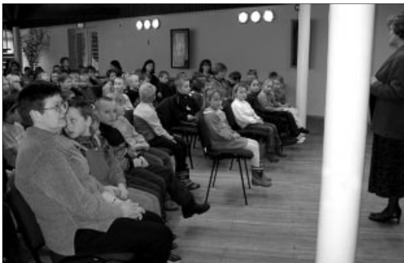
● Emakeelepäeval osalesid ka tulevased koolijütsid.