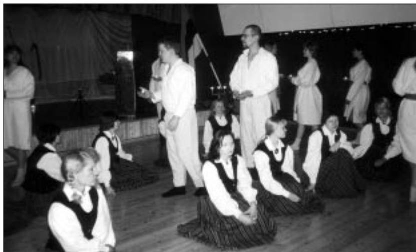
● Tánassilma Rahvamajas esinesid naisrahvatantsurühm "Kaheksakand" ja lauljad.