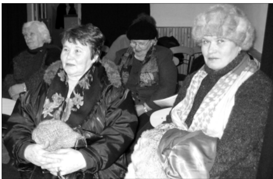
Kultuurikoja kohvikusse oli vallavalitsust kuulama tulnud alla 20 linnakodaniku.

Kõnniteede hooldamise- ga peavad tegelema krundi-