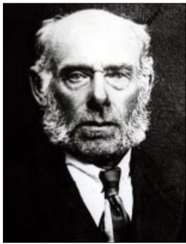
Kustav Tamm Foto Tapa muuseumi arhiivist

1905. a üldine mässulaine haaras ka Lehtse valda. Rahvasuu kandis edasi riimid: “Mõisad põlevad, saksad surevad, maa ja mets saab rahvale” 6. novembril 1905 korraldati Lehtse vallamaja ruumides koosolek Tallinna turuplatsil mahalastute mälestuseks. Lehtse mõisnik parun Hoeningen-Huene lasi kohalikul sandarmil osa koosoleku üritusi ära keelata (sh langenute perekondade heaks annetuste kogumine jm), mil-