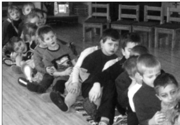
Kahe lasteaias lapsed rahvumänge mängimas.