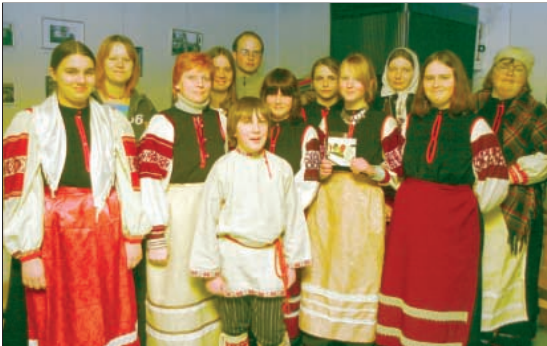
Tsibihärbläsed oma plaadi esitlusel maslenitsa aegu Obinit-sa Seto Seltsimajas.