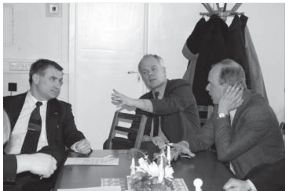
Regionaalminister Jaan Õunapuu visiit. Tihemetsa õppekeskuse saatuse üle arutlevad minister, Pärnu maavanem Toomas Kivimägi ja Saarde vallavolikogu esimees Väino Lill.