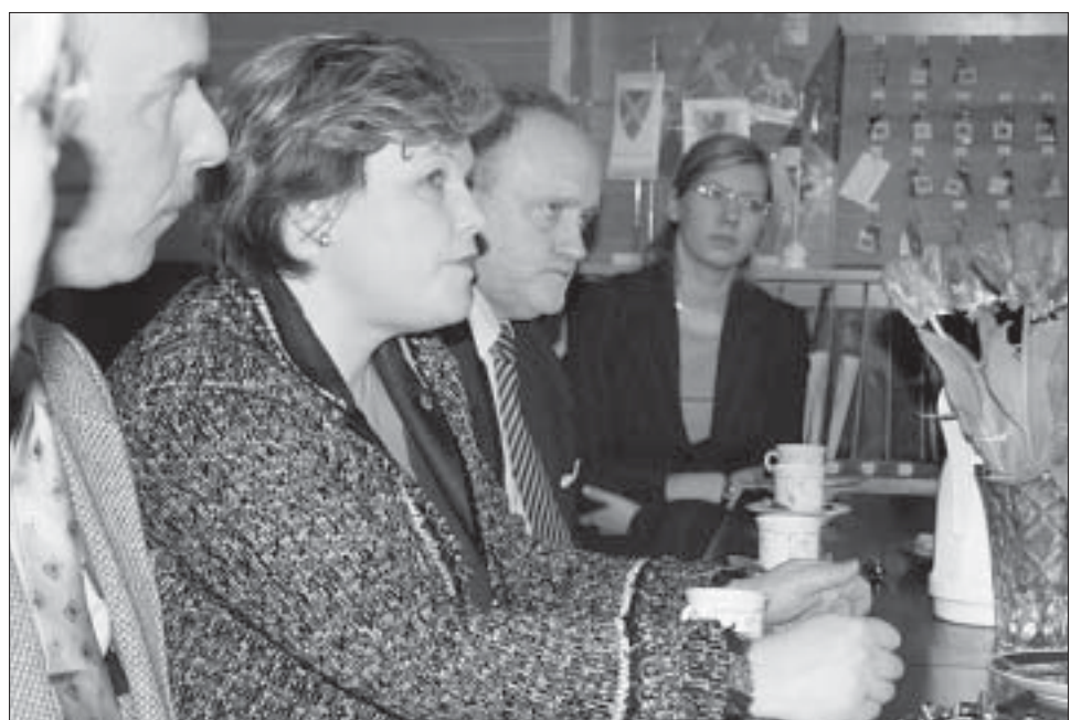
Põllumajandusminister Ester Tuiksoo ja Riigikogu kultuurikomisjoni esimees Jaak Allik Tihemetsas.