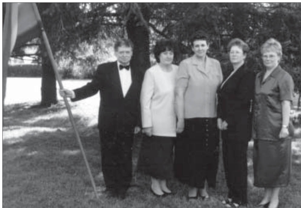
Kilingi-Nõmme MÜ juhatus.

tiivne monopol maal. Tekib pal- ju erakauplusi.