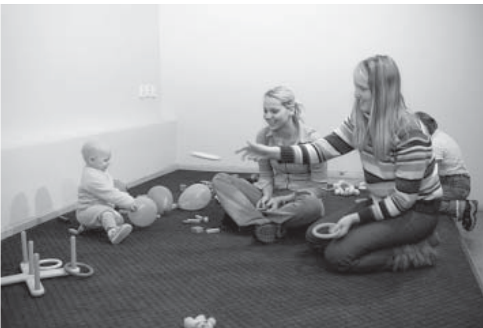
Mida tahta veel, kui müramise ja lõbutsemise eest saab igasugu magusat!