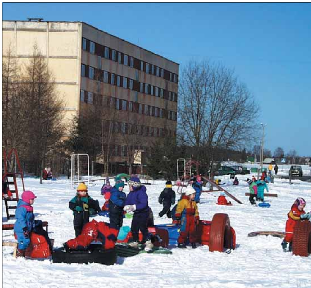
Tänavune linnaelurõõm võimaldab lasteaedade ja koolide põhjalikku remonti. Oluliselt on suurenenud ka toetused lastega peredele.