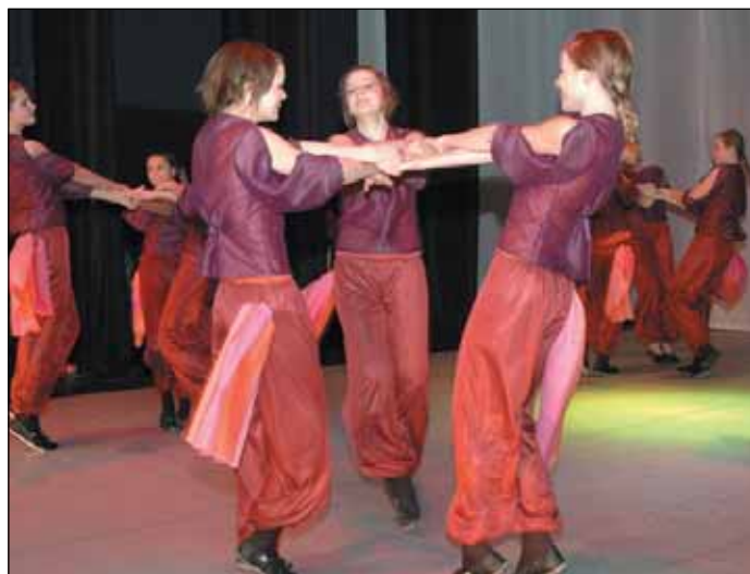
Jõgeva kultuurikeskuse tantsustuudio rühm "Föönix" pääses koolitantsu maakondlikust eelvoorust edasi nagu ka mitmed teised tantsustuudio rühmad.