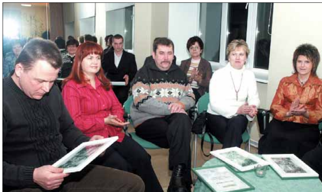
Neid Jõgeva linnaelanikke, kes tänavu jõulude ajal eramaju, kortermaju ja asutusi maitsekalt kaunistasid, oli üllatavalt palju.