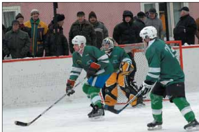
28. jaanuaril tähistati Jõgeva jäähoki 60. sünnipäeva.