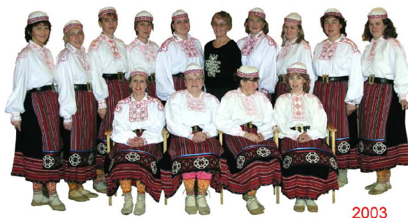
Juuru rahvamaja teenekas naistantsurühm.