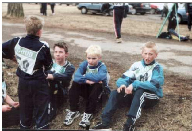
Hetk peale pingutavat jooksu.