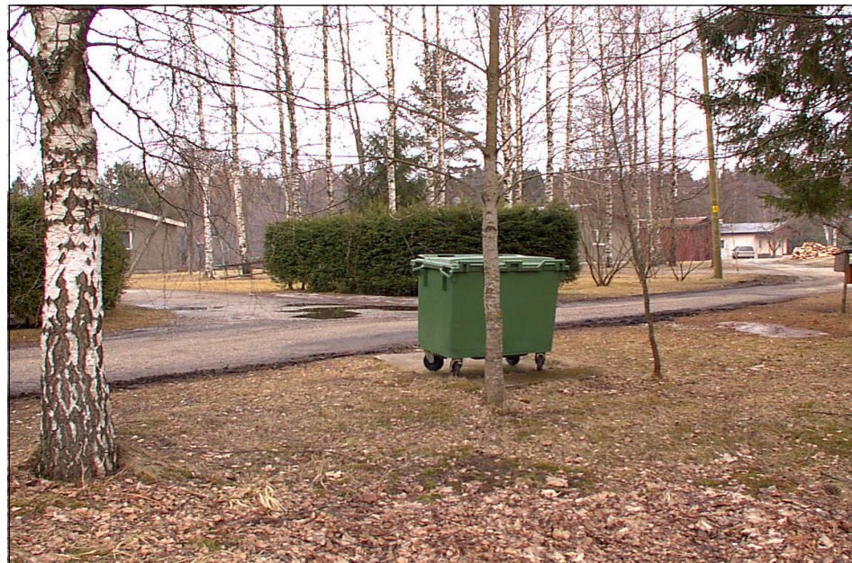
Võib ka nii: sõbralikud naabrid kasutavad ühte konteinerit - praktiline ja odav