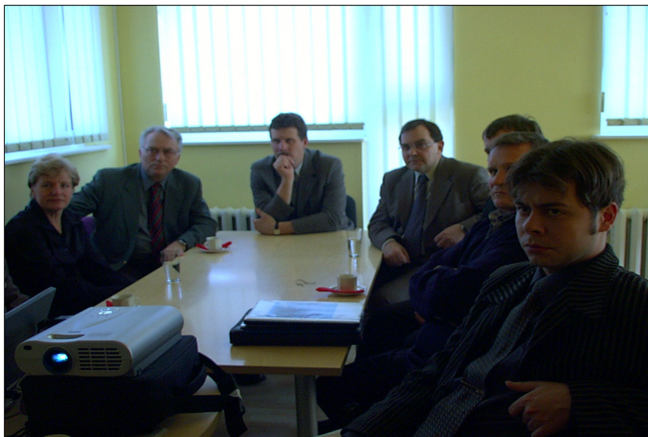
27.märtsil said meie vallavanema kutsel kokku Eesti Olümpiakomitee president Mart Siimann, maakonna spordijuhid, valla esindajad ning veekeskust rajama hakkavad ettevõtjad, et kaaluda võimalust rajada Eesti laskespordi rahadega veekeskusesse kaasagne lasketiir.

Muidugi ei jätku sellise väljaku loomiseks vaid EOK