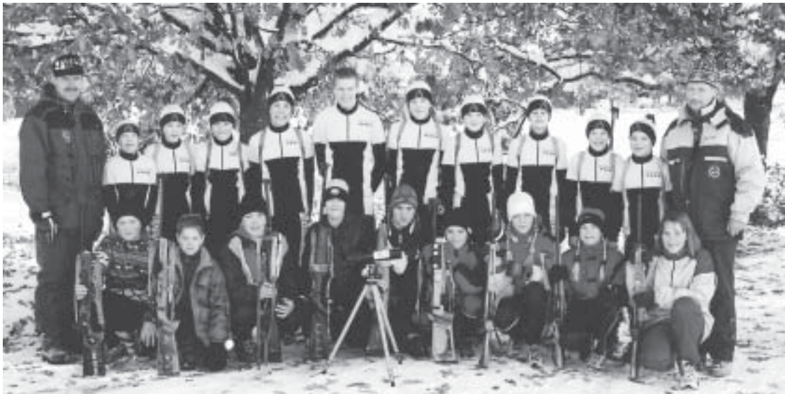
Otepää noorte elav huvi laskesuusatamise vastu annab lootust julgelt tulevikku vaadata.

Tulemuste seisukohalt on oluline iga sportlase individuaalne areng. Pjdestaalikohiti on ainult kolm, aga ennast saab võrrelda ka treeningkaaslaste ja konkurentidega. Laskesuusatamises jõudsid