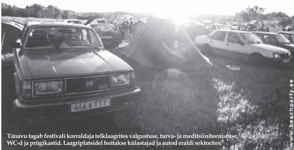
Tänavu tagab festivali korraldaja telklaagrites valgustuse, turva- ja meditsiiniteenistuse, WC-d ja prügikastid. Laagriplatsidel hoitakse külalastajad ja autod eraldi sektorites.

Müratase festivali ajal viiakse tervisekaitse normidega kooskõlla, heliseire aedlinnas viib iga 3 tunni järel läbi korraldaja tellitud helitehnika rendiga tegelev ettevõtte. Öörahu tagamiseks kehtestatakse piiratud müratasemega aeg kell 23-07. Reostuse vähendamiseks paigaldatakse Tamme puiesteele tualetteid ja prügikonteinerid, aedlinna tänavatele tuuakse korra kindlustamiseks täiendavad jalgsipatrullid.