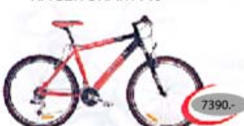
RACER SRAM 7.0

24-käiguline alumiiniumraamiga maastikuratas