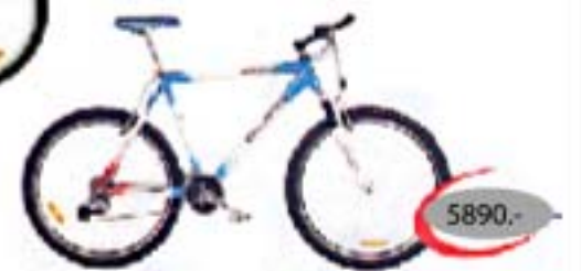
EXPERT SRAM 5.0