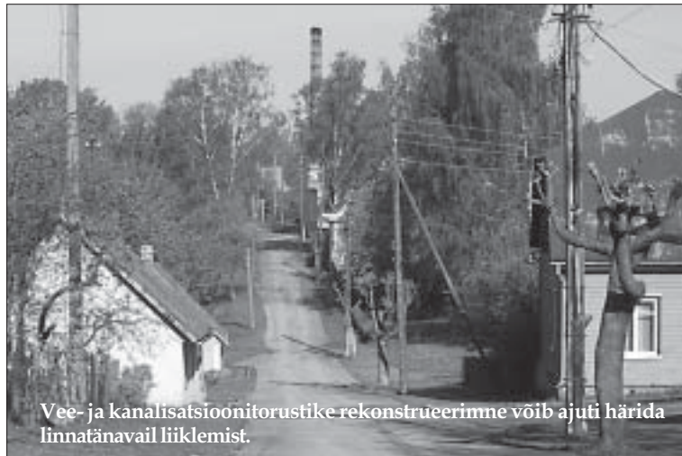
Vee- ja kanalisatsioonitorustike rekonstrueerimine võib ajuti härida linnatänavail liiklemist.

ni. Eesti riigi abi on kaks milj. krooni ning ülejäänud osa finantseeritakse Otepää valla ja AS Otepää Veevõrk laenuga.