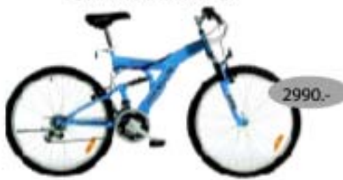
SRAM MRX FS