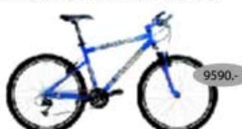
CORRATEC FREERIDE ALIVIO

24-käiguline esiamordiga alumiiniumraamiga võistlusuratas