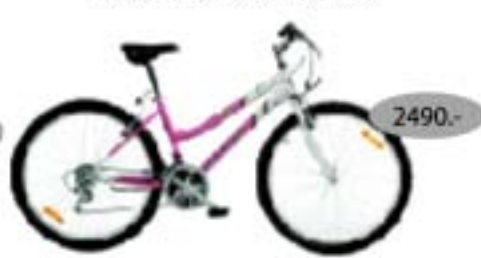
LADY SRAM MRX

18-käiguline kahe amordiga sportlik maastikuratas