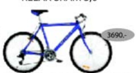
RELAX SRAM 3,0