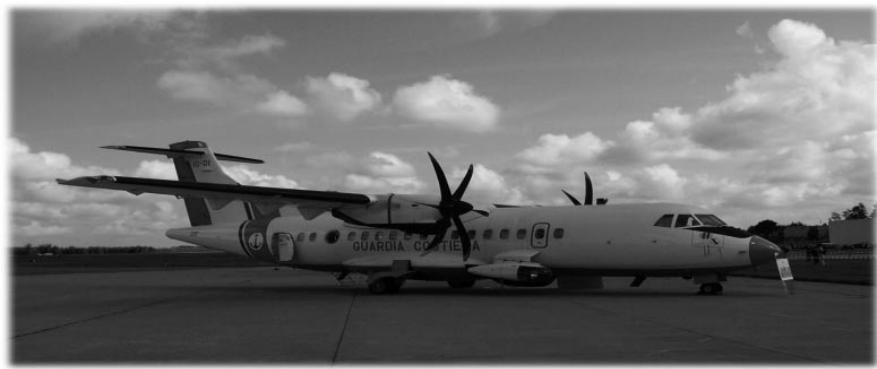
Itaalia rannavalvurite käsutuses olevat lennukit ATR 42 MP Surveyor on kaasaegne jälgimistehnika nii merevalveks kui mereostuse avastamiseks.

Kuus Eesti piirivalve esindajat osalesid 23.-25. augustil Rootsi Rannavalve lennudevõime 25. aastapäevaüritustel, mille raames korraldati rahvusvaheline seminar merejälgimise korraldamise kohta lennukite abil, patrull-lennukite demonstratsioon, pressikonverents ning pidulik õhtusöök Nyköpingi lossis.