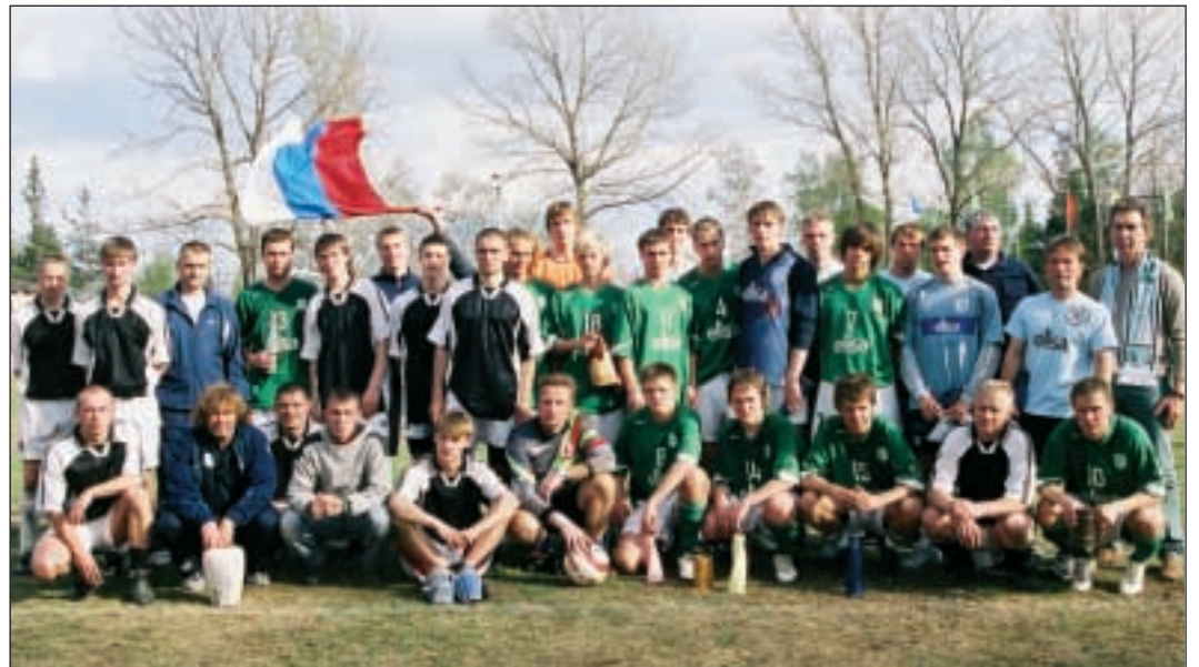
Petseri jalgpalliklubi Temp ja Tallinna FC Flora meeskonnad Petseris eestiaegsel staadionil peale sõpruskohtumist 9. mail 2006.