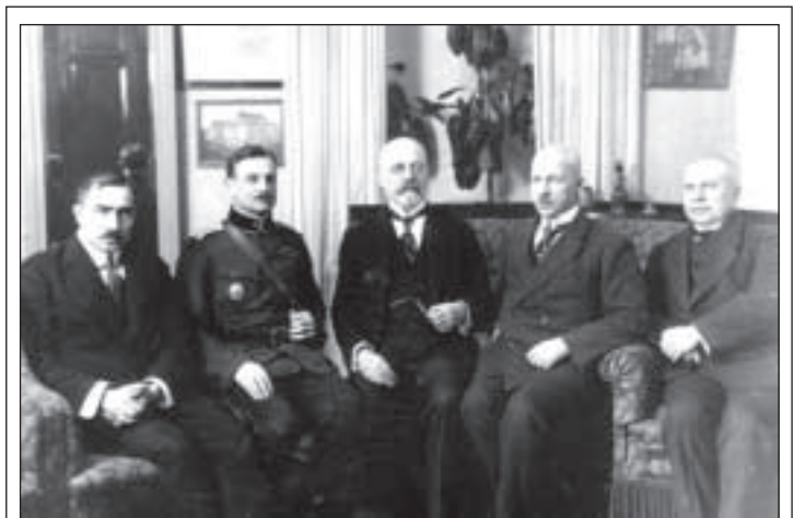
Eesti ja Vene delegatsiooni juhid 1920. aasta 2. veebruaril Tartus peale rahulepingule allkirjutamist. Vasakul ääres Vene delegatsiooni esimees Adolf Joffe, paremal Jaan Poska.