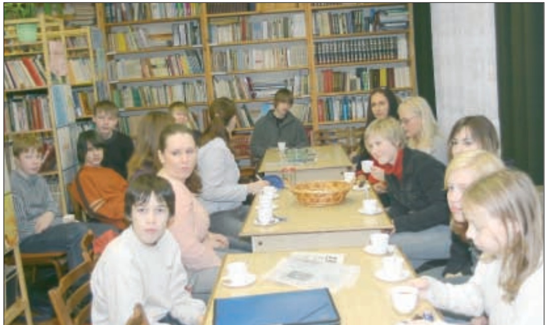
Setomaa ainukeses gümnaasiumis Värskas õpib 195 õpilast. Pildil Värskas Gümnaasiumi raamatukogus õpilasi, kes tunnevad huvi ajakirjanduse ja kirjanduse vastu ja kes jaanuaris toimunud kohtumisel „Setomaa“ toimetajaga esitasid küsimusi ajalehe tegemisest, samuti kirjakeele ja oma kandi kõnekeele vahetõrjast perioodilises väljaandes.

Tasakaal on tähtis. Igaühel on midagi anda ja igaühel on vahel kellegi abi tarvis. Suured teod algavad tihtipeale palju pisematest. Teeme oma kodud ja külad korda, aitame naabrinaisi ja -mehi, teeme ühiselt midagi kasulikku küla jaoks ja midagi toredat eneste jaoks. Kui meie küladel läheb hästi, on suur tõenäosus, et ka